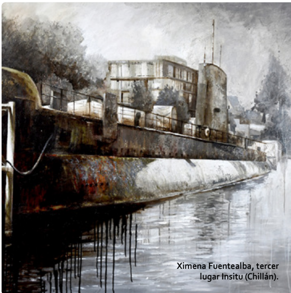
Ximena Fuentealba, tercer lugar Insitu (Chillán).