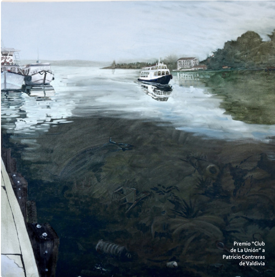
Premio "Club de La Unión" a Patricio Contreras de Valdivia

El certamen que inició el 24 de enero y donde participaron un total de 178 concursantes en las categorías infantil y juvenil, durante tres días pintaron desde sus casas o desde diversos lugares de la ciudad de Valdivia para retratar el paisaje humano y natural que caracteriza la zona.