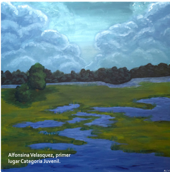
Alfonsina Velásquez, primer lugar Categoría Juvenil.

El certamen que inició el 24 de enero y donde participaron un total de 178 concursantes en las categorías infantil y juvenil, durante tres días pintaron desde sus casas o desde diversos lugares de la ciudad de Valdivia para retratar el paisaje humano y natural que caracteriza la zona.