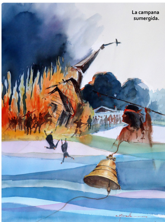
La campana sumergida.

La exposición “Navegando los misterios de Valdivia” estará abierta a todo público de lunes a sábado, de 10 a 13 horas y de 15 a 19 horas, hasta el 30 de agosto en los salones de CCM, Los Robles 04, Isla Teja. 🇨🇱