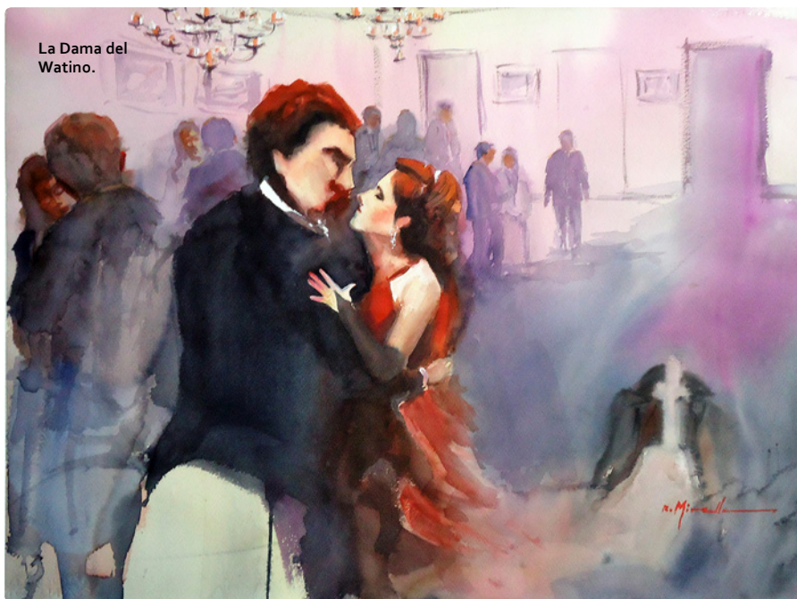
La Dama del Watino.

El artista realizó cerca de veinte obras gracias a este proyecto Conarte que se adjudicó el año pasado.