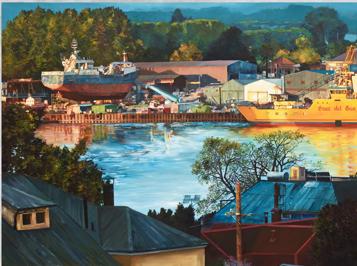
Duhamel Xolot, premio Sergio Montecinos 2019.