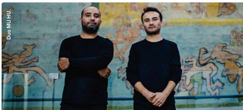
Duo MU HU.