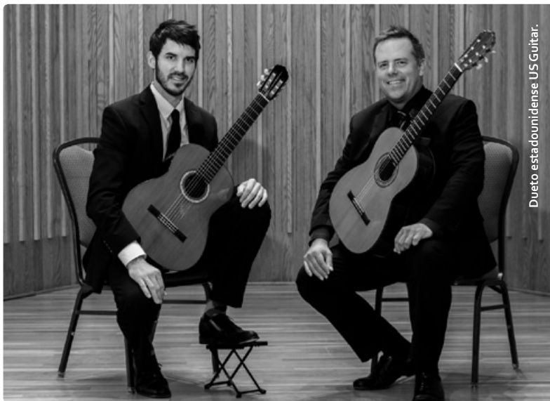
Dueto estadounidense US Guitar.