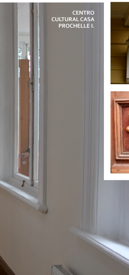
CENTRO CULTURAL CASA PROCELLE I.