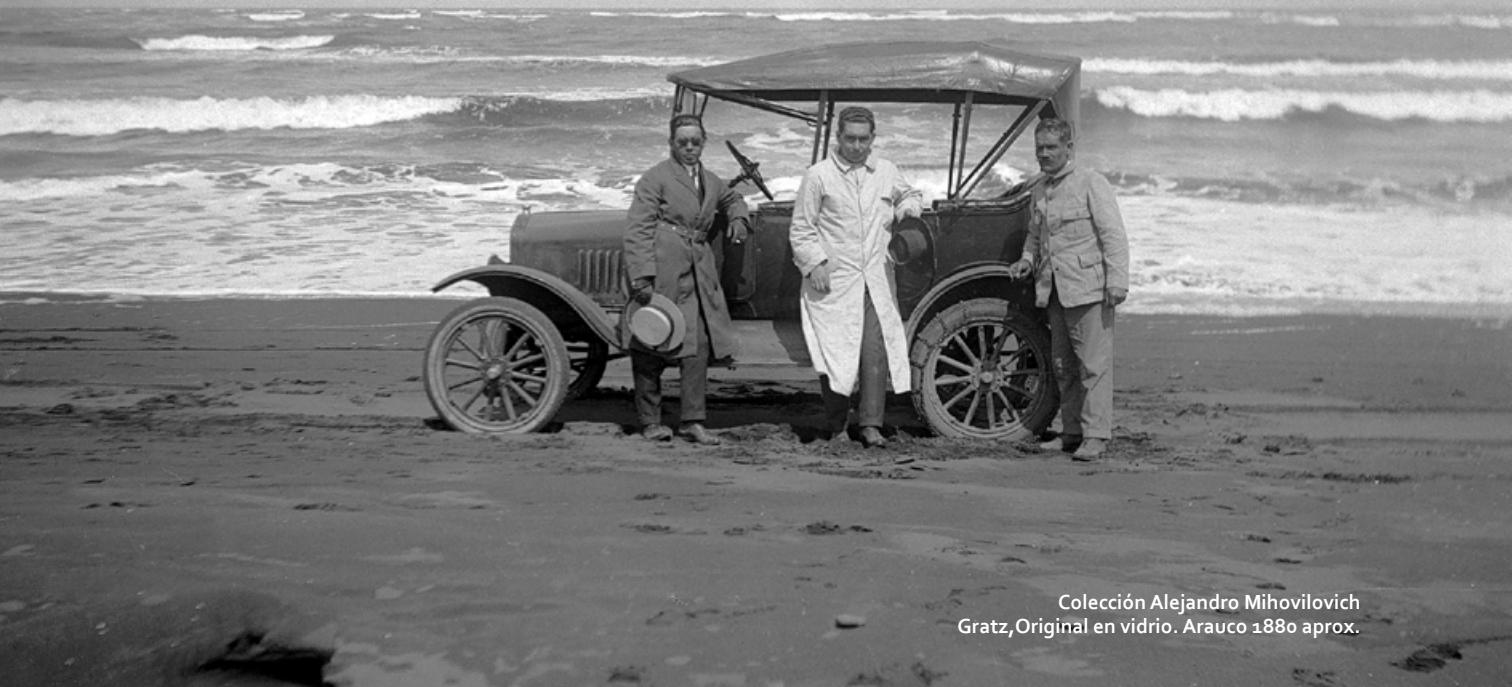
Original en vidrio. Arauco 1880 aprox.