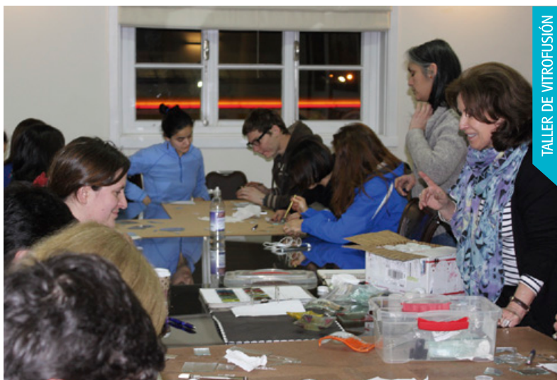
TALLER DE VITROFUSIÓN

Enseñar fotografía presenta algunas complejidades, pero ésta es una audiencia que se supone no es profesional, y en lo general se aprenderá la técnica, donde la fotografía debe estar bien tomada, tiene que tener precisión en luz y definición; el segundo aspecto es la composición, es decir, cómo está armada la fotografía, qué elementos tiene para que sea una fotografía bien ordenada, visualmente correcta, con espacios que se equilibren; y el tercer aspecto es la parte emotiva, la parte emocional, o comunicacional”.