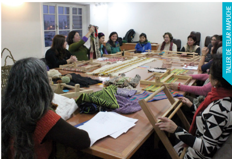
TALLER DE TELAR MAPUCHE

“El objetivo del taller tiene que ver fundamentalmente en poder gene-