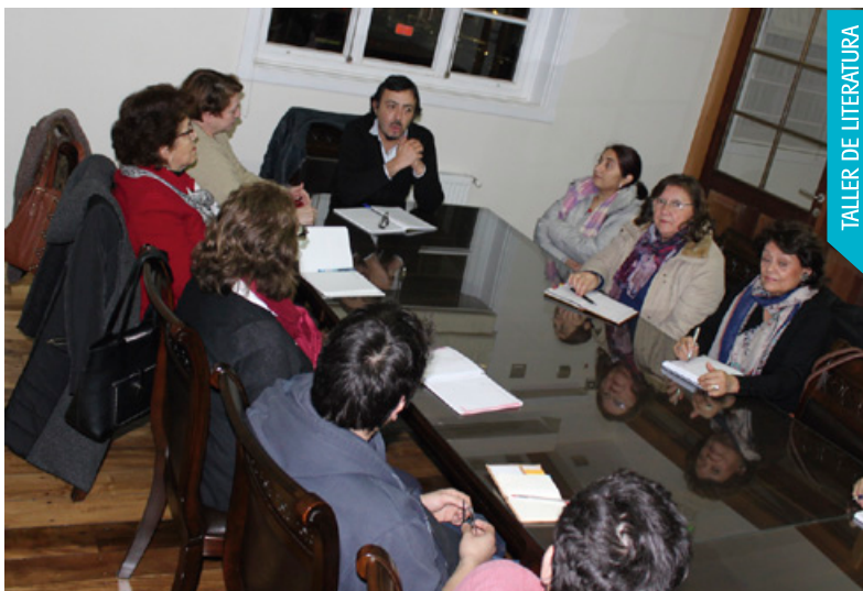
TALLER DE LITERATURA