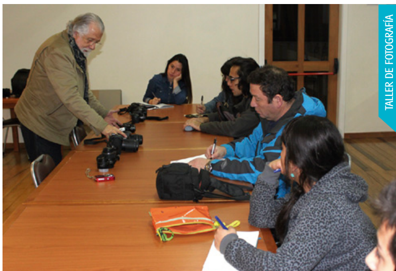
TALLER DE FOTOGRAFÍA

“Este es un taller de lenguaje de cómics, está dirigido principalmente a jóvenes, pero no está exento a que cualquier persona pueda participar. El objetivo del taller es tomar los aspectos generales del lenguaje del cómic, poder construir personajes, hacer duplas entre ilustradores y guionistas, y poder fabricar al final de curso un producto que en este caso sería un fanzine, que es una revista mas artesanal, y el contenido será elaborado íntegramente por los alumnos”.