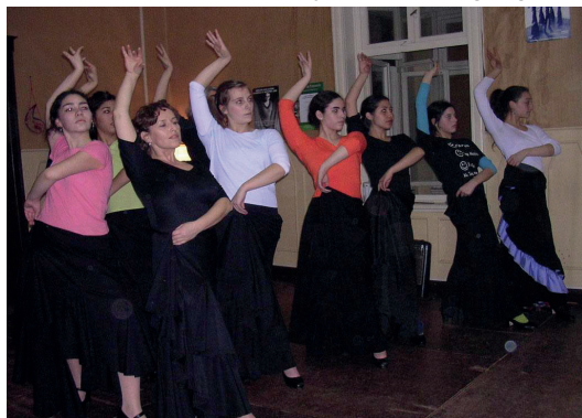
Alumnas de la compañía ponen en práctica sus conocimientos.

Actualmente, a pesar de ser una cultura en plena expansión, el flamenco posee intacto el sello distintivo que lo ha hecho conquistar miles de adherentes en el mundo entero.