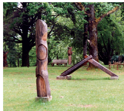
Parque de las Esculturas

Museo de la Catedral: Tiene una exposición permanente de Objetos Religiosos Cristianos de Valdivia, de los siglos XVI al XIX. Horario: de 10 a 13 horas. Entrada General: $ 500 Independencia 514.