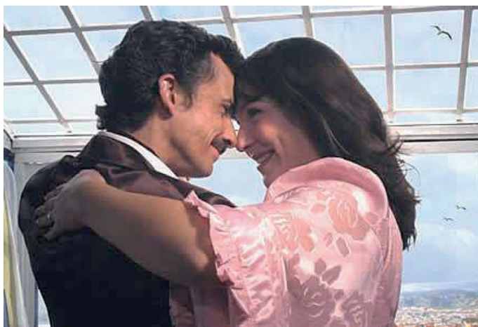
Importantes estrenos del Cine Nacional

Este joven realizador de 29 años, tiene varias producciones cinematográficas en el cuerpo. Su actividad audiovisual la divide entre su trabajo para la televisión ECM en Londres y la de sus propios proyectos como "Shoot me" (2002) y "Hong Kong" (2003). Además, se desempeñó como guionista en el largometraje chileno "Los Debutan