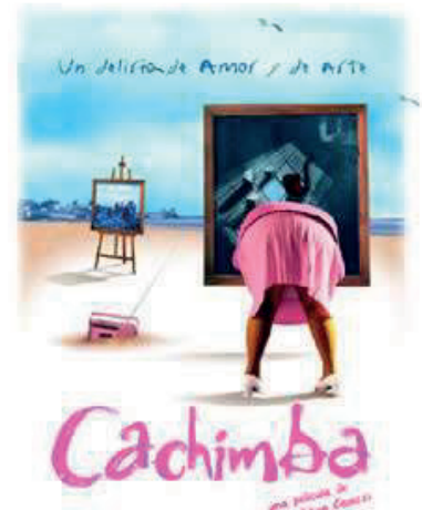
La película de Silvio Caiozzi abrió el certamen 2004.