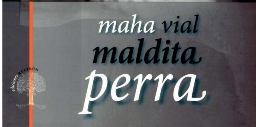
La artista espera lanzar su libro próximamente

ciertas máscaras y como se van desarmando con el alcohol”, señala la artista.