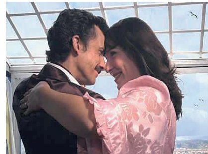
XI Festival de Cine