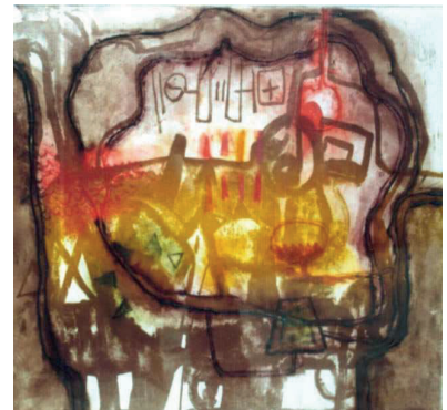
Epicentro de un Arbp1 con un mar Litografía

Por otra parte, comenta que pinta y graba por inspiración y que no siente que el “acto creativo” represente una experiencia distinta del acto creativo de la música o la poesía. “Es una verdadera tentación creer en la jerarquización cuando vemos que hay distintas artes. Pero nada puede existir