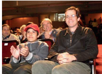
Machuca de Andrés Wood se quedó con el premio Pudú 2004

Otro gran director chileno que destacó en este certamen fue Andrés Wood con el premiado largometraje "Machuca". El film causó gran revuelo dentro del público valdiviano que repletó las salas del Teatro Cervantes y Lord Cochrane. Además, la película celebró en la ciudad de los Ríos su nominación para ser candidata chilena en la postulación de los premios "Oscar" y "Goya", frente a la que destacadas figuras del mundo del cine nacional señalaron por los medios de comunicación estar de acuerdo con la decisión tomada por el jurado. "Mala leche" puso la cuota de marginalidad dentro del desfile de producciones nacionales. Dirigida por León Errázuriz acaparó la atención de los españoles quienes al parecer disfru-