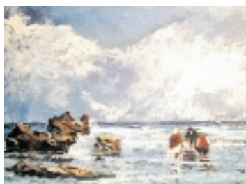
Mes del Mar