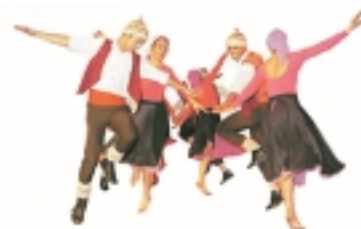
Dirección de Extensión