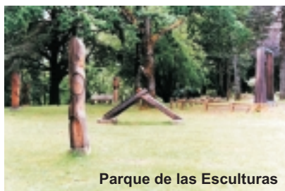
Parque de las Esculturas

Parque de las Esculturas: Posee 25 esculturas contemporáneas en madera, metal y piedra. Ubicado en Parque Saval - Isla Teja. Entrada: Sólo ingreso al Parque Saval. Más información al teléfono 219690.