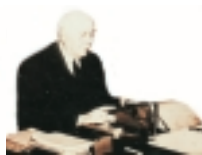
Concurso de Cuentos Fernando Santiván