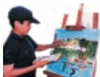
XXII Concurso de Pintura