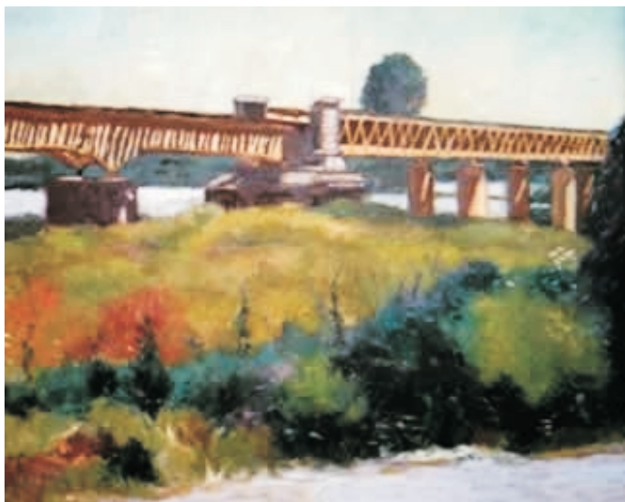
Puente Ferroviario, Albino Echeverría C.