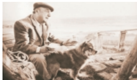
Natalicio de Pablo Neruda