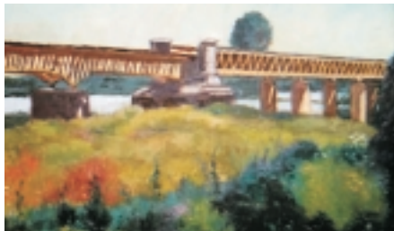
Centro Cultural "El Austral"