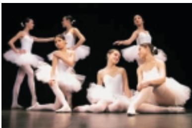
Día Internacional de la Danza