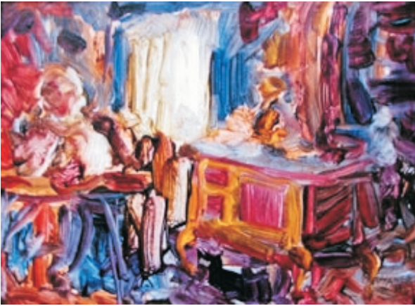
"Cocina Sureña" Oleo