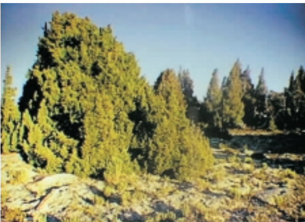
Alerce, conífera que puede alcanzar hasta los 50 metros de altura y 5 de diámetro,

El alerce es una conífera que puede alcanzar hasta los 50 metros de altura y 5 de diámetro, y la segunda especie vegetal más longeva del mundo; encontrándose especímenes de hasta 3.600 años de antigüedad. En Chile fue declarado Monumento Nacional en 1976 para detener su tala indiscriminada y así protegerlo de su extinción, por tener una madera de larga duración que fue utilizada para hacer tejuelas, con las cuales se han construido la mayor parte de las casas antiguas del sur del país. En la actualidad, esta especie se distribuye principalmente en nuestro país, en forma discontinua entre los paralelos 39° 50' W y 43° 30' S y en menor medida en Argentina. Crece entre la Cordillera de Los Andes y la de la Costa, generalmente hasta los 1.000 metros sobre el nivel del mar. Se desarrolla en pequeños bosques remanentes, sobre terrenos planos mal drenados entre el Lago Llanquihue y Puerto Montt, pero su población está concentrada en las provincias de Llanquihue y Palena.