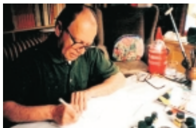
Grandes Ilustradores en Valdivia.