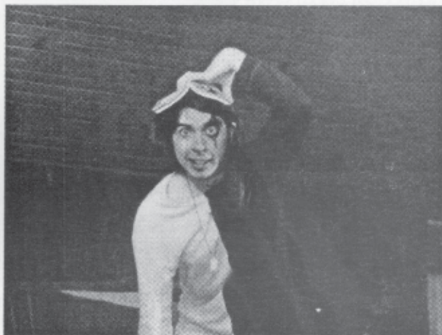
Compañía "Teatro de la Lluvia"