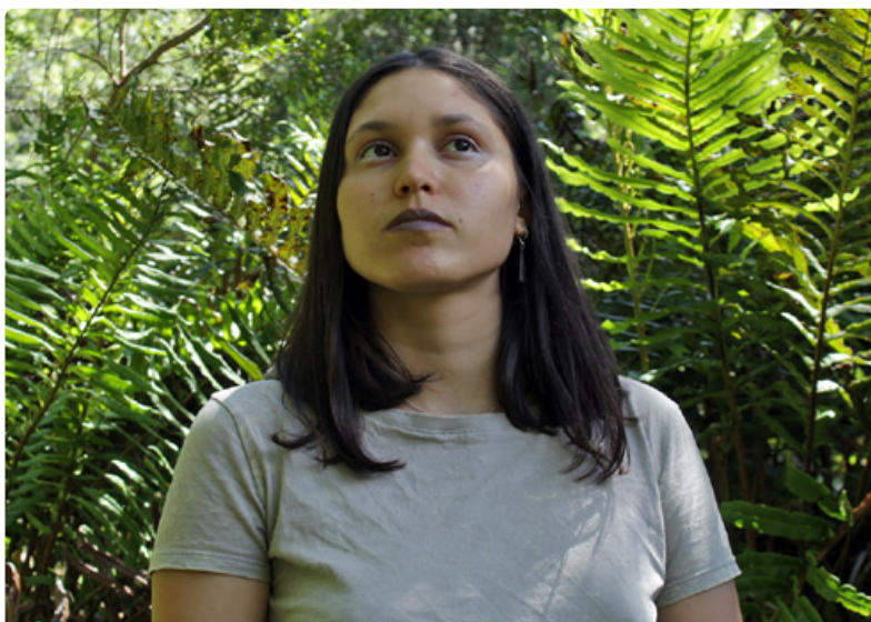
Conarte: Producción y difusión videoclip "Paskurana".