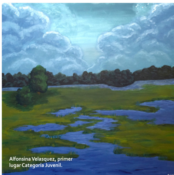
Alfonsina Velasquez, primer lugar Categoría Juvenil.

El certamen que inició el 24 de enero y donde participaron un total de 178 concursantes en las categorías infantil y juvenil, durante tres días pintaron desde sus casas o desde diversos lugares de la ciudad de Valdivia para retratar el paisaje humano y natural que caracteriza la zona.