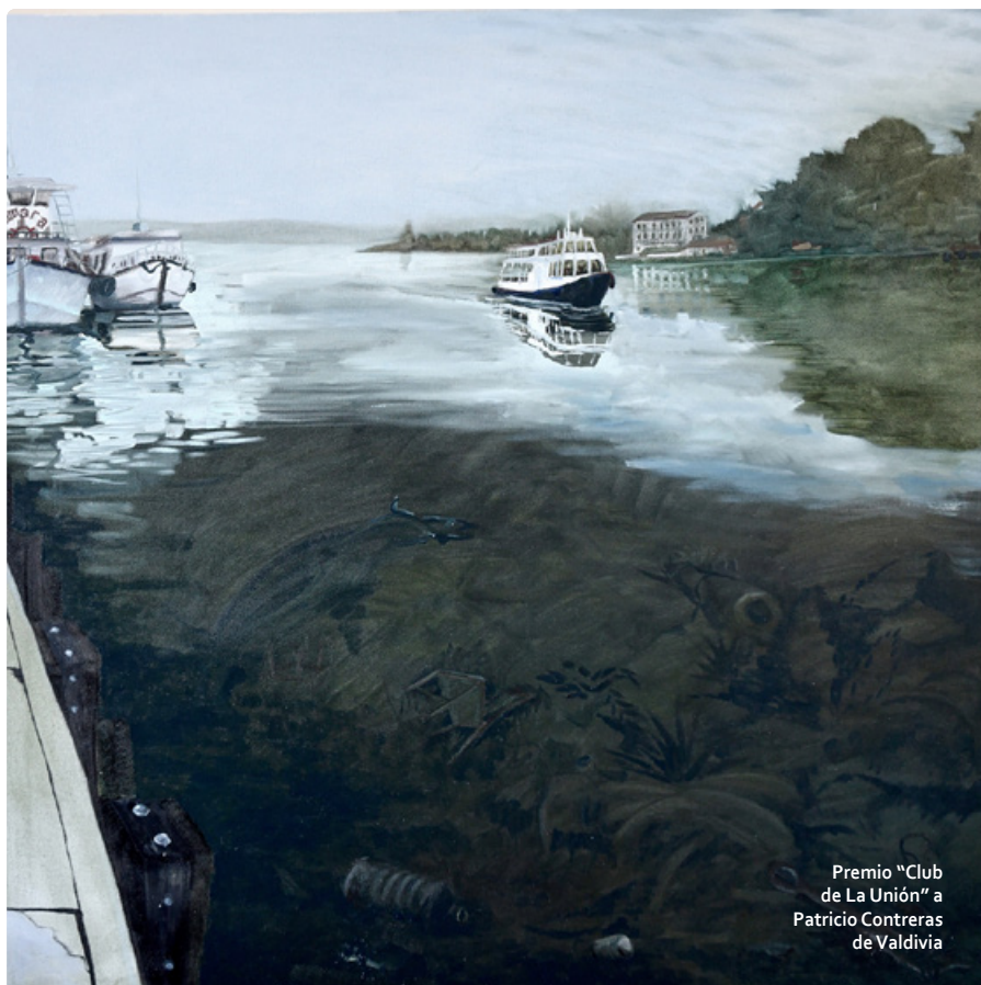
Premio "Club de La Unión" a Patricio Contreras de Valdivia

El certamen que inició el 24 de enero y donde participaron un total de 178 concursantes en las categorías infantil y juvenil, durante tres días pintaron desde sus casas o desde diversos lugares de la ciudad de Valdivia para retratar el paisaje humano y natural que caracteriza la zona.