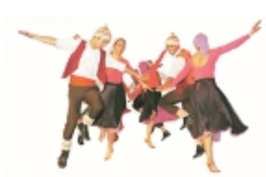
Dirección de Extensión