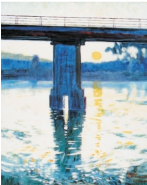
Puente Río Renaico, Iván Contreras