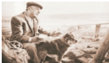
Natalicio de Pablo Neruda