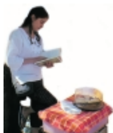
Lectura en la feria fluvial