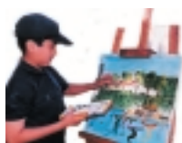
XXII Concurso de Pintura