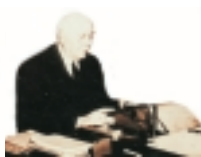
Concurso de Cuentos Fernando Santiván