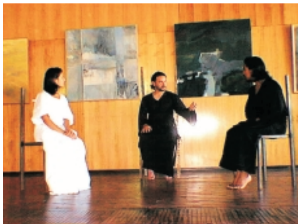
Compañía Teatro Génesis previo a la presentación.