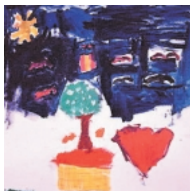
Valdivia y su Río 2004 Tercer Lugar Categoría Infantil Valentina Aros, 6 años.