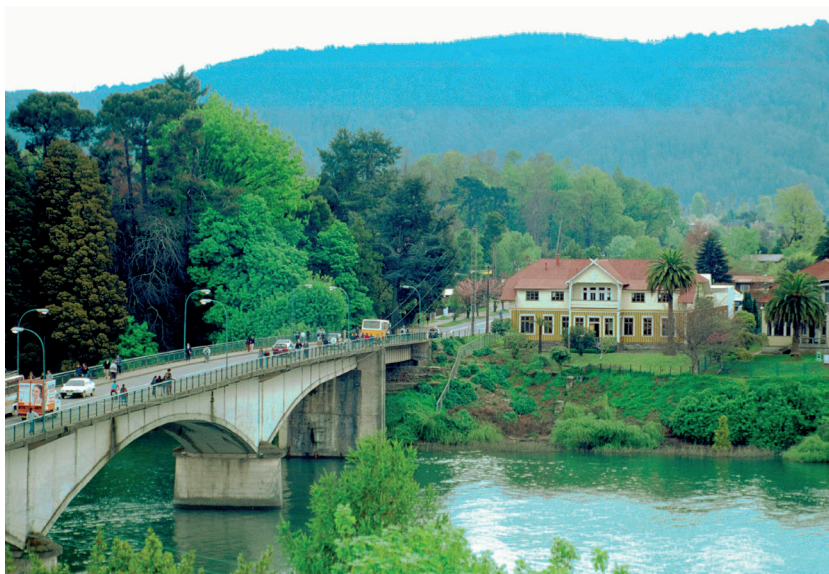
Con la recuperación de la casa Prochelle 1 se abren posibilidades para ampliar la costanera cultural hacia el lado norte del puente Pedro de Valdivia.

Así el proyecto de recuperación de la casa patrimonial suma un elemento más a su favor. Ya no sólo aparece su puesta en valor a través del uso como centro cultural, su contribución al rescate de la herencia arquitectónica o su emplazamiento en un entorno de gran belleza natural.