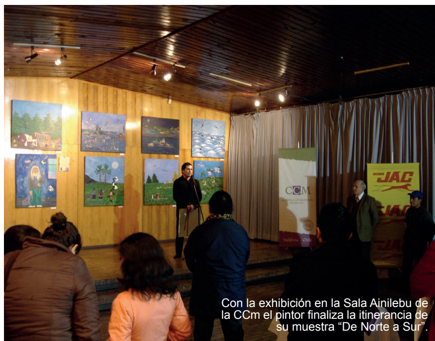
Con la exhibición en la Sala Ainilebu de la CCm el pintor finaliza la itinerancia de su muestra "De Norte a Sur".