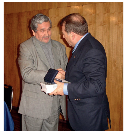
El certamen entrega 800 mil pesos al primer lugar

Pero es quizás la publicación de los cuentos ganadores el mayor