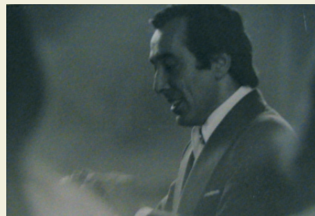
Gira a Punta Arenas con el coro de la U. Técnica del Estado. Principios de 1970