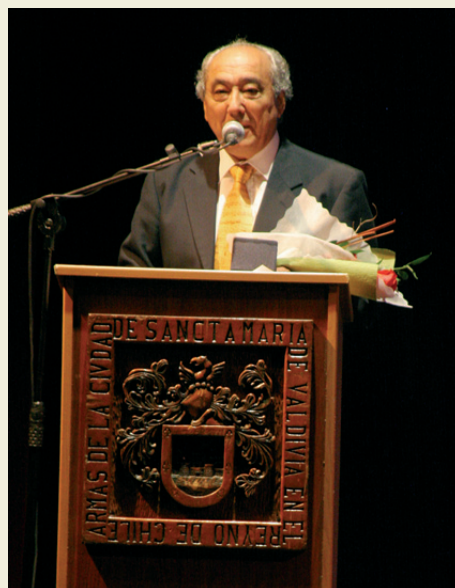
Reconocimiento Premio Municipal de Arte, 2010.

Mira yo nunca he buscado galardones ni nada parecido. Mi trabajo es mi pasión y eso es impagable. Poder enseñar y sentir que los estudiantes están aprendiendo de mis conocimientos genera algo especial en mi vida. A mis años no pretendo retirarme, es más, quiero continuar año a año viajando, generando iniciativas para todos, entregar este arte que es tan lindo. La verdad es que debo reconocer que he hecho de la música un pretexto para la formación de mejores personas.