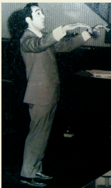
Dirigiendo el coro de la U. Técnica del Estado. Principios de 1970

En nada. Es más ya ves que de algo ha servido tanto alegato (ríe). A través de los años uno se va dando cuenta que ciertas cosas no funcionan como debieran. Por eso uno debe estar al día con las cosas que pasan. Este año por ejemplo fue el tema del terremoto y los porcentajes de cultura de los FND. Hubo mucho revuelo al respecto pero si nosotros como región no alzamos la voz, las cosas quedan en nada. Creo que uno debe ser protago-