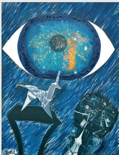
Blade Runner de Ridley Scott