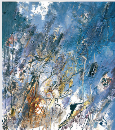
Stalker de Andrei Tarkovsky.