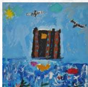
3° lugar: Florencia Urrea (6 años).

agrega la comisaria encargada junto al jurado de evaluar también las obras de los menores de 18 años.