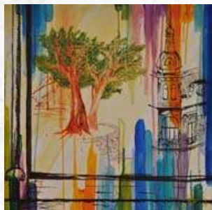
2° lugar: Javiera Saavedra (14 años).