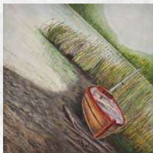
1° lugar: Paola Cárcamo (17 años).