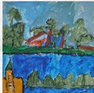
2° lugar: Gabriel Figueroa (7 años).