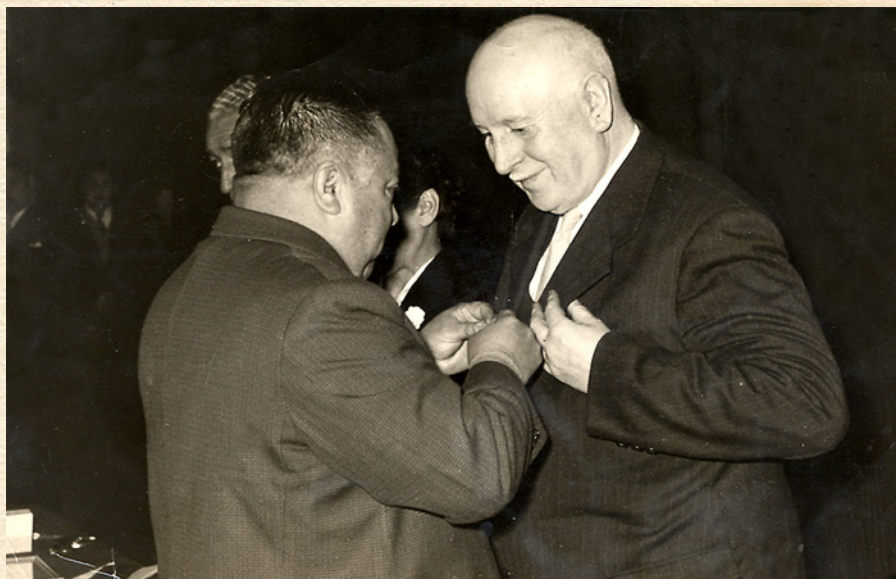
Entrega del Premio Municipal de Extensión Cultural y Artística de la Ilustre Municipalidad de Valdivia, en el año 1965.

La Corporación Cultural de la Ilustre Municipalidad de Valdivia (CCM) -a pocos días del cierre de la convocatoria- invita a