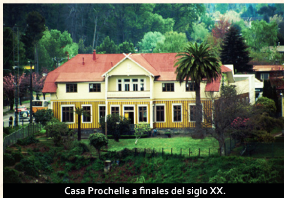
Casa Prochelle a finales del siglo XX.

del segundo nivel fue utilizado por la familia -entre otras cosas- como gimnasio y para realizar trabajos de lavandería como el secado de ropa. En total, sumando la edificación y los terrenos adyacentes, la propiedad abarca 2294 metros cuadrados.